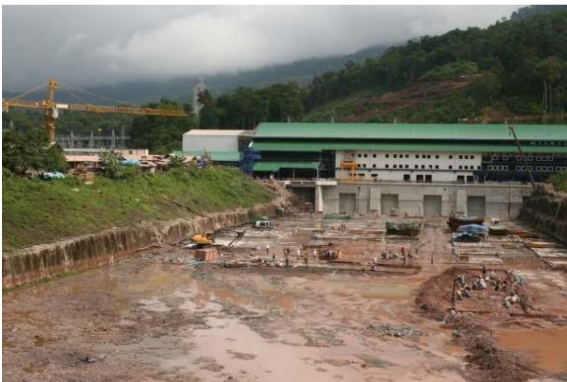
Nam Theun 2

Mer om Asiabanken og deltakelse og åpenhet i kapittel 4 og 5.