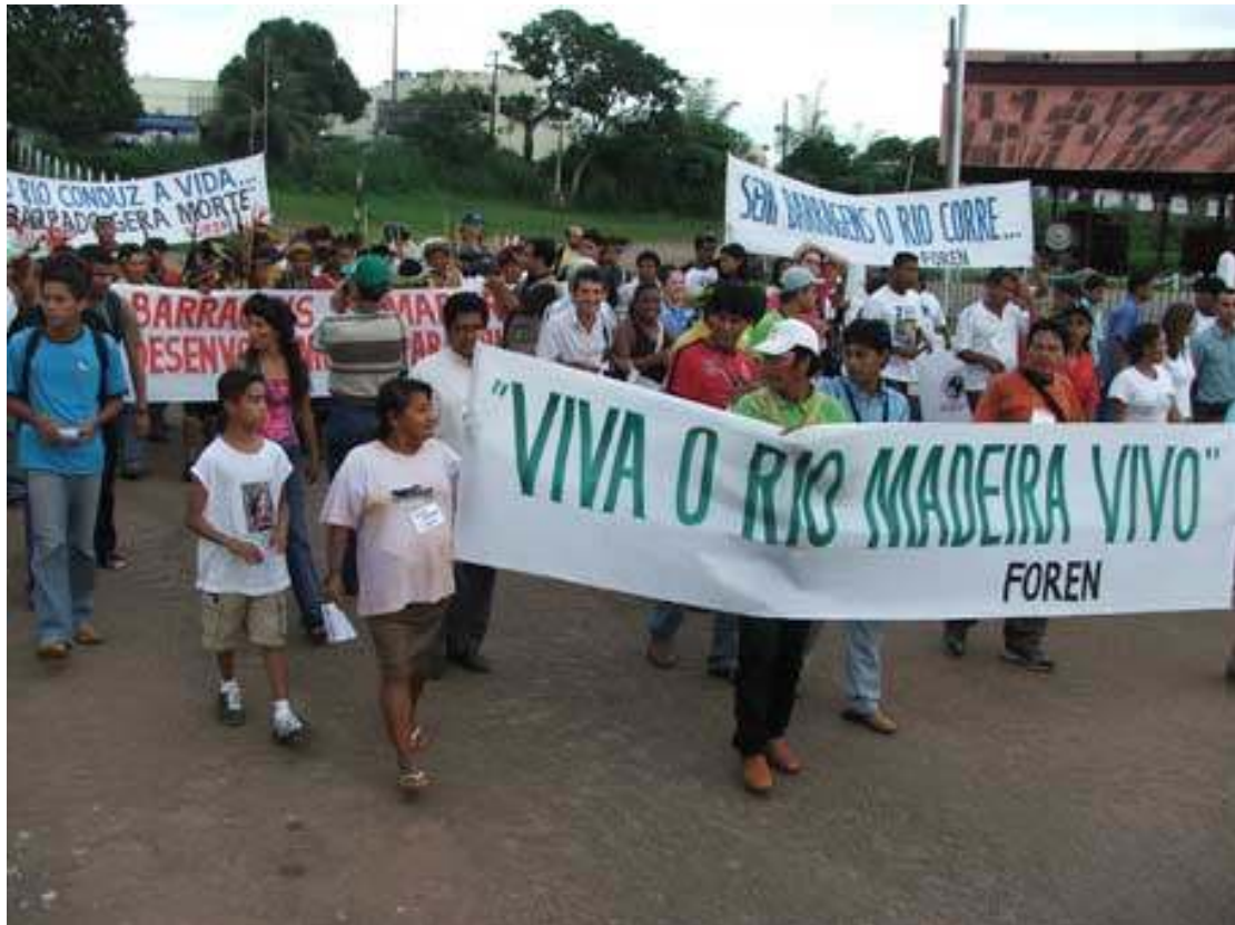
Protest mot Madeira-prosjektet.