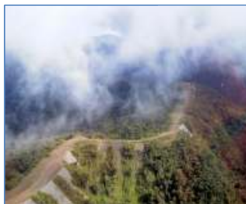
sjektet baner vei.

I 2003 godkjente IDB et lån til det gigantiske gassprosjektet Camisea i Peru. Gassutvinningen foregår i den sårbare peruanske Amazonas, og nesten 75 prosent av gassen befinner seg på områder som tilhører et urfolkreservat. Ledningene som fører gassen innover i landet vil gå gjennom sårbare regnskog. Miljøorganisasjoner og urfolkbevegelsen i landet har protestert kraftig mot utbyggingen, men ikke blitt hørt. Siden Camisea-prosjektet startet i 2000 har ulykker ført til seks utslipp av flytende gass, og mange av de som bor i området har fått eiendommene sine ødelagt av jordras og erosjon, og mistet fiskemulighetene sine. Urfolkene har tidligere hatt ingen eller svært lite kontakt med omverden, og har dermed ikke opparbeidet seg beskyttelse mot vanlige sykdommer. Etter at byggingen har begynt, og tilført arbeidere utenfra, har sykdommer, ofte