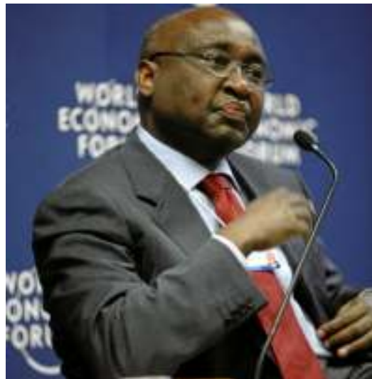
Donald Kaberuka, president i Afrikabanken

Rwandiske Donald Kaberuka har sittet som president siden 2005.