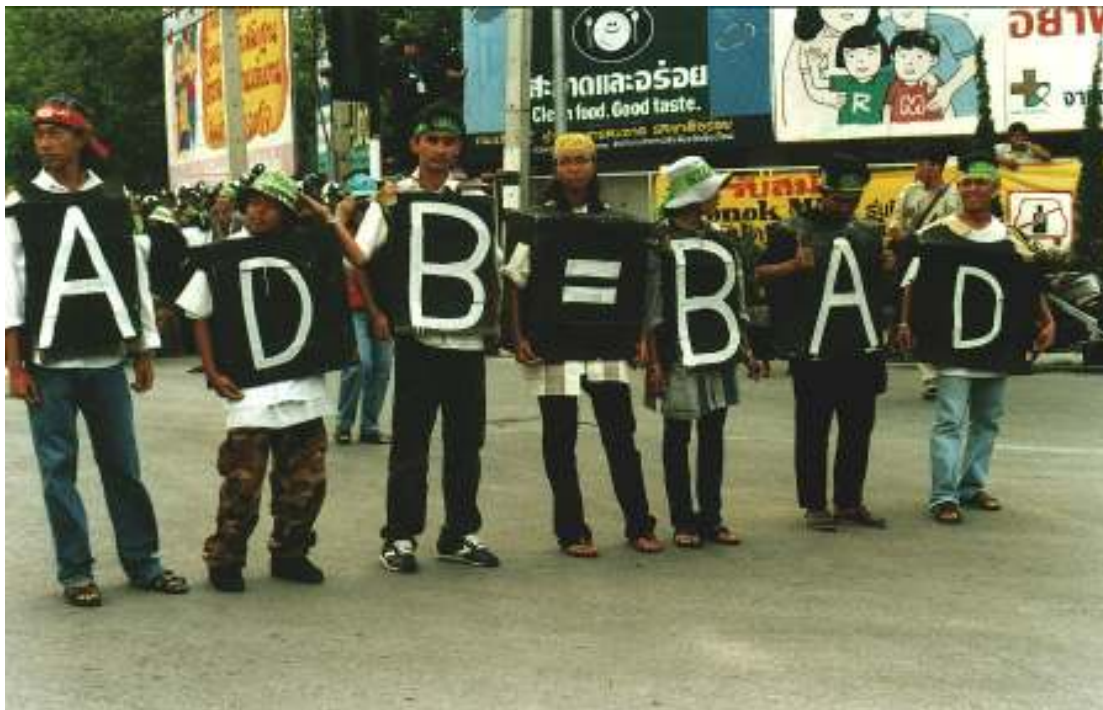
Aktivister i Thailand protesterer mot den asiatiske utviklingsbanken

Afrikabanken har, som de andre regionale utviklingsbankene, generelt fått lite oppmerksomhet fra sivilsamfunnet, både i Norge og i resten av verden. Det er flere grunner til