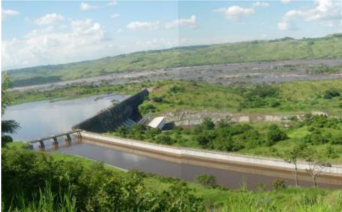
Inga-kraftverket i Kongoelven.