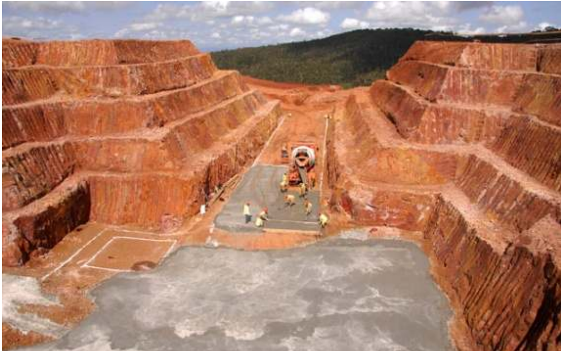
Ambatovy nikkelgruve, Madagaskar