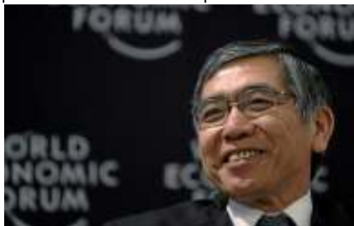
Haruhiko Kuroda, president i Asiabanken

Japanske Haruhiko Kuroda har sittet som president siden 2004 (ble gjenvalgt i 2006). På grunn av Japans store finansielle bidrag til banken, er det en uskreven regel at presidenten kommer fra Japan.