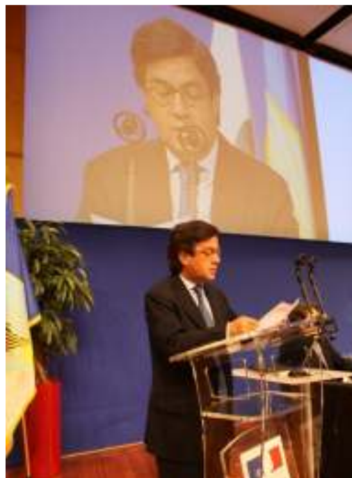
Luis Alberto Moreno, president i den interamerikanske utviklingsbanken

Colombianske Luis Alberto Moreno har sittet som president siden 2005.