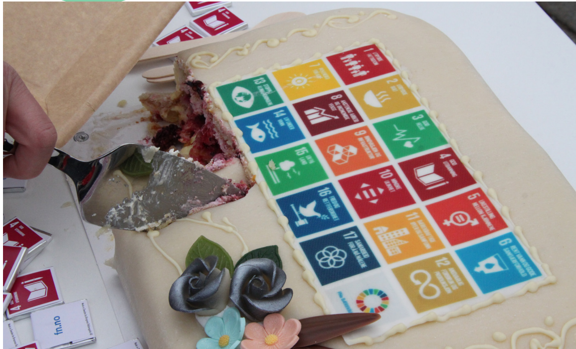
ForUM og FN-sambandet feiret at Stortinget vedtok en handlingsplan for FNs bærekraftsmål.

Krig, matpriskrise og ekstremvær til tross – hvilke seiere kan vi feire fra 2022? Bli litt mer håpefull ved å lese om noen av gjennomslagene vi fikk i 2022! Bak gjennomslagene står flere organisasjoner sammen. Se hvem som deltar i ForUMs arbeidsgrupper under hvert tema .