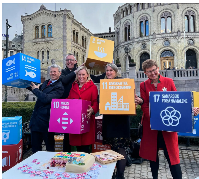
ForUM har siden 2015 jobbet for en norsk handlingsplan for FNs bærekraftsmål. Da Stortinget i 2022 vedtok en slik plan, inviterte ForUM og FN-sambandet stortingspolitikterne til feiring.

FN-sambandet, Kirkens Nødhjelp, Fairtrade Norge, Sex og Politikk, Mellomkirkelig råd, Changemaker, Regnskogfondet, Spire, FORUT, Norges Kristne Råd, KFUK-KFUM Global, Lightup Movement, Redd Barna, Unicef, LNU, Strømmestiftelsen, Care, Digni, Osloenteret