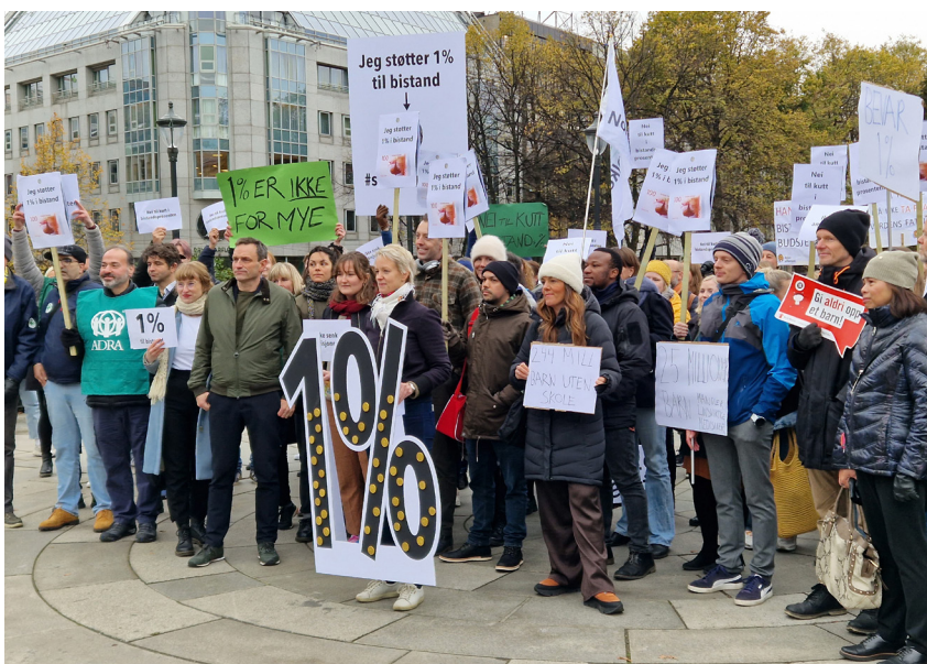
Fra demonstrasjon for å bevare Regjeringens politikk om å gi 1% av vår BNI i bistand. ForUM stod bak demonstrasjonen sammen med 48 organisasjoner og ungdomspartier.

ForUMs arbeidsgruppe for utviklingsfinansiering Redd Barna, Kirkens Nødhjelp, Tax Justice Norge, Changemaker, SLUG, Spire, Mellomkirkelig råd for Den norske kirke