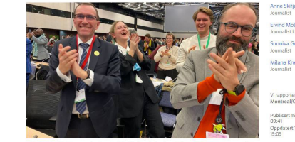
NATURAVTALE: Etter to uker har de 196 deltakende landene blitt enige om en naturavtale. Her jubler klima- og miljøminister Espen Barth Eide.

Etter to uker med forhandlinger i Canada har verdens land kommet til enighet om en naturavtale.