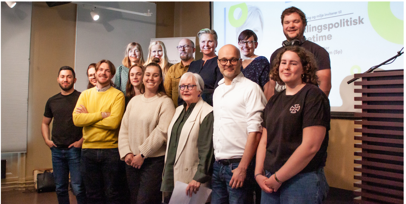
Også i 2022 arrangerte ForUM utviklingspolitisk spørretime med utviklingsministeren, der en rekke av ForUMs medlemsorganisasjoner får stille ministeren hvert sitt spørsmål. Her er representantene fra medlemsorganisasjonene som i 2022 stilte spørsmål til Anne Beathe Tvinneim.