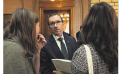
PAKK MER ENN TANNBØRSTE: Klimaminister Espen Barth Eide må følge opp fagre ord med handling på klimatoppmøtet i Sharm el-Sheikh neste uke, skriver forfatterne.