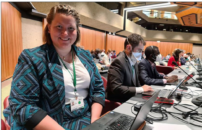
Nær 80 prosent av den best bevarte naturen i verden, finnes vi i områder som er kontrollert av urfolk, forteller fagrådgiver Ingrid Rostad i Forum for utvikling og miljø.