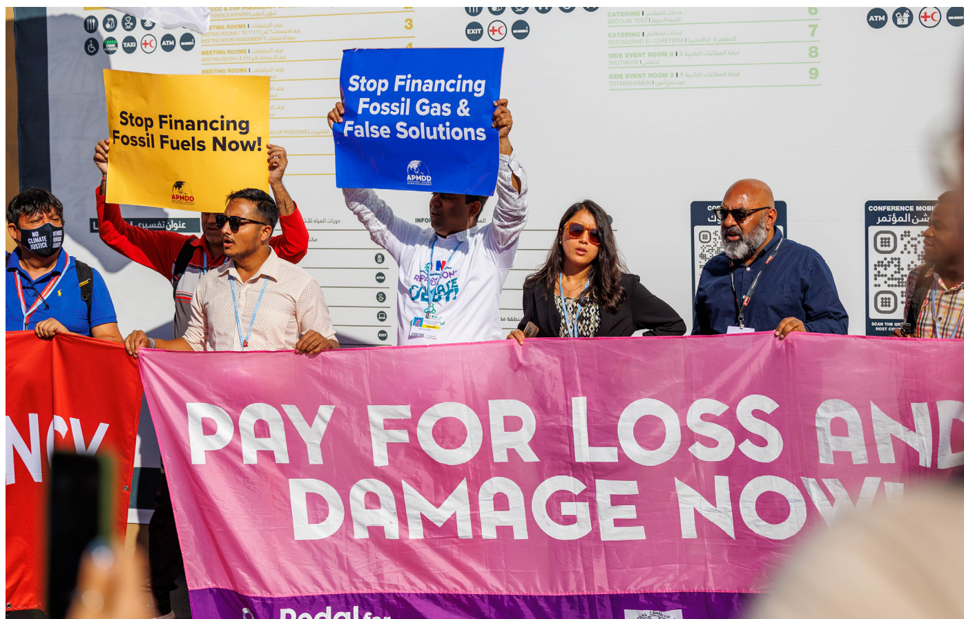
Fra en demonstrasjon under COP27 i Egypt for midler til klimarelaterte tap og skader. Et nytt fond for tap og skade var en av årets store klimaseiere.