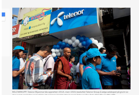
MILJØKONFERANSE: Telenor Myanmar ble opprettet i 2014, men i 2021 ble det etablert Telenor Group i tillegg til selskapet på grunn av den svært vanskelige og kaotiske situasjonen i landet etter kuppet i februar i 2021.

ForUM var i 2022 mye i media. Særlig løftet vi Telenors salg av virksomheten i Myanmar, forslagen i kutt i bistandsbudsjettet, FNs naturavtale og FNs klimatoppmøte.