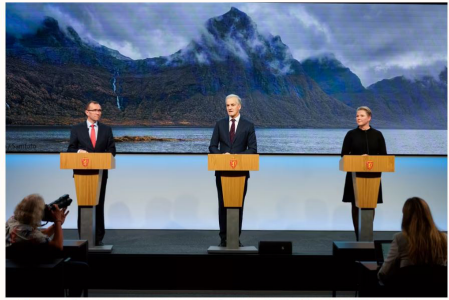
Statsminister Jonas Gahr Støre (A), utvklingsminister Anne Brautrud (Sp) og klimo- og miljøvernminister Espen Barth Eide (A) på scenen for Pils-Brige klimatoppmøtet i Sharm el-Sheikh i Egypt.

Norge og EU skal etter planen inngå en industriavtale under klimatoppmøtet i Sharm el-Sheik i Egypt. Et lekket utkast om støtte til norsk oljeleting har skapt avis hos klima- og miljøorganisasjonene.